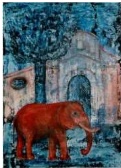
IMKA, "Elefant vor dem Famagustator in Nikosia"