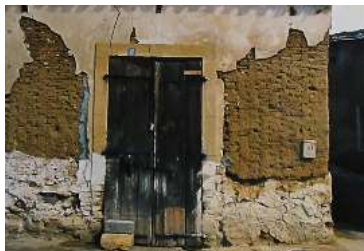
"Im Fluß der Zeit - Zypern"