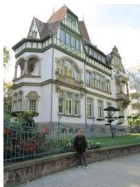
IMKA vor dem Ausstellungsgebäude, Manoir du Contades, in Straßburg 2010

Mit einem Klick auf den Link, wird der Artikel sichtbar."© Dernières Nouvelles D'alsace , Mardi 21 Septembre 2010. - Tous droits de reproduction réservés."