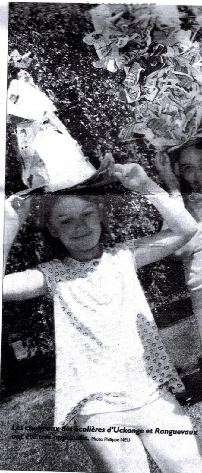
Les chapeaux des écolières d'Uckange et Ranguévaux ont été très applaudis.

Meubles, robes, sculptures ou chapeaux. Une démonstration, hier, à Hayange, lors de la journée au parc de l'Orangerie pour la journée